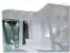
特装展位示例 (不含搭建费)